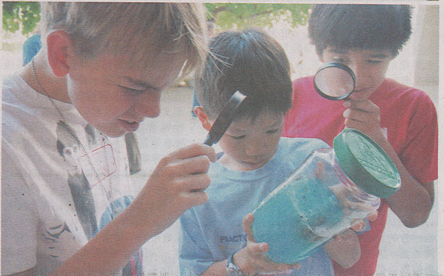
學生們難得有機會使用放大鏡觀察螞蟻的生活型態。記者汪佳燕攝