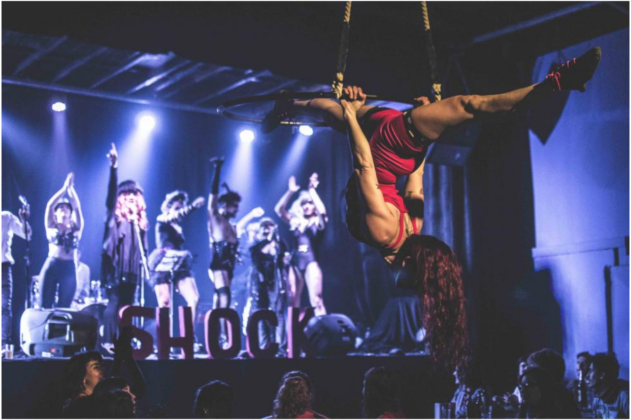
Las Noches Bizarrras. Emergente Bar, 2016.